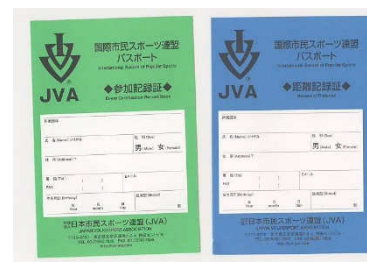
初回パスポートセット

札幌歩こう会に入会された会員は、入会時に初回 IVV (JVA) パスポートが無料で配布されます。(会員でない方は有料 200 円)